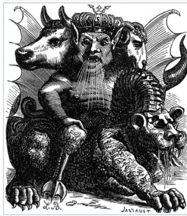
El Demonio Asmodeo tal y como aparece representado

en los *Dictionaries Infernal* de Jacques Collin de Plancy c. 1818 Francia