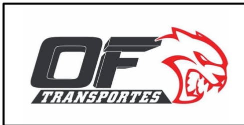
OF Transportes Logo