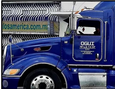
Ogui Fletes Truck

nombre del CJNG y falsifica documentos aduaneros para el CJNG con el fin de facilitar el traslado transfronterizo ilícito de combustible. Juraidini importa combustible de Estados Unidos a México que está etiquetado de forma intencionadamente errónea en la documentación aduanera para eludir los impuestos mexicanos del IEPS. La mayoría de los clientes de Juraidini son empresas de gasolineras, que reciben los productos de combustible refinado y los venden a través de gasolineras minoristas. Juraidini genera decenas de millones de dólares al año, lo que beneficia al CJNG.