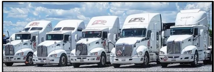
OF Transportes Trucks